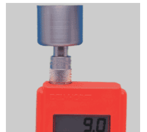
52-E/C voor Katoenvruchten