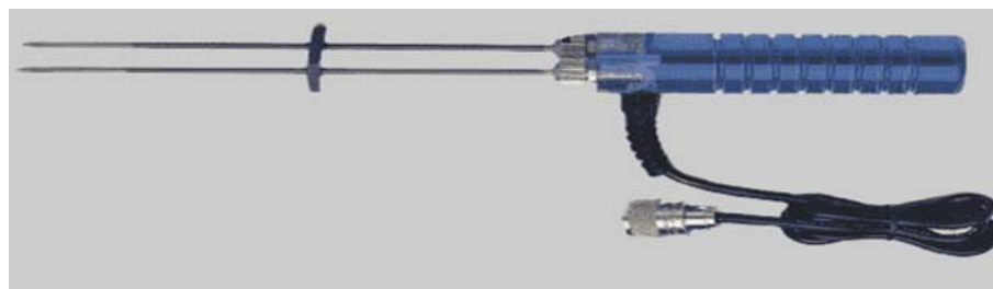
30-E/C, 20 cm. geïsoleerde pennen voor balen, geen risico van oppervlakte vochtmeting